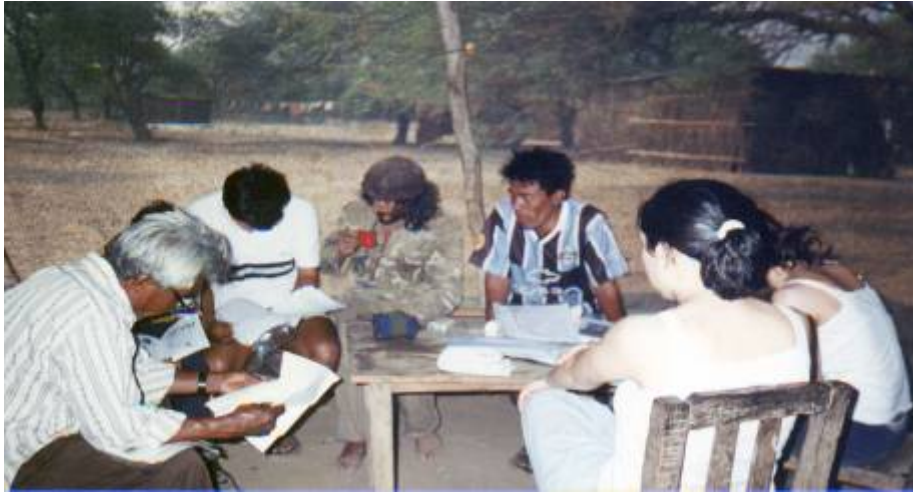
Taller sobre la Historia de la Colonia Buenaventura – La Estrella – Año 2000

De esta manera, en el año 2000 se realizó un taller sobre la Historia de la Colonia Buenaventura, en el que participaron integrantes de las comunidades de la región del Pilcomayo, dando comienzo a un trabajo de historia y memoria oral sobre los últimos cien años en la zona.