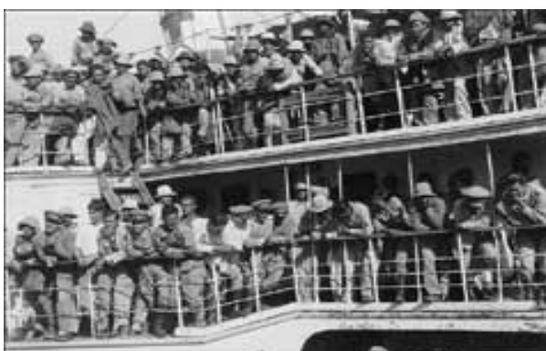
Guerra del Chaco 1932-1935. Villarica. Tercer convoy sanitario. 1934