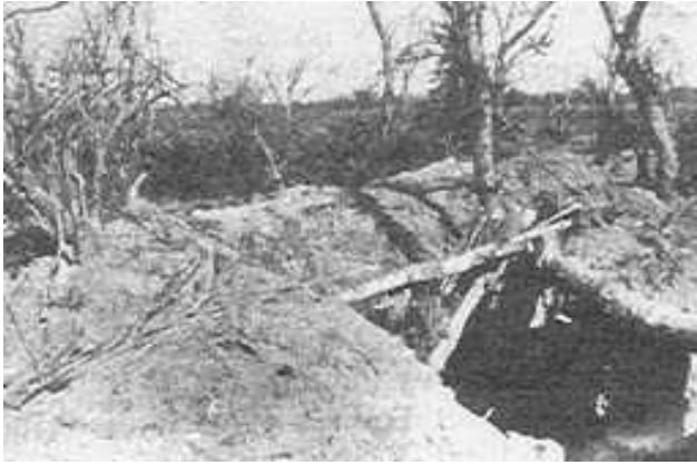
UNA TRINCHERA EN EL CHACO