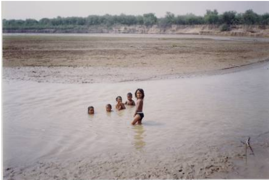
Niños bañándose en el Río Pilcomayo

Más tarde, cuando empezaron los gendarmes a controlar quienes cruzaban, el río pasó a ser una frontera más definida.