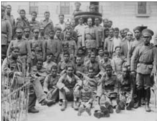
Guerra del Chaco 1932-1935. Provincia de Inquisivi, Quime. Grupo de prisioneros de guerra paraguayos.

“Y cuando pasa la guerra, se dice que, como no había Hito 1, no había militares acá, la gente se iba a camppear a La Banda, y ellos vieron muchas armas que estaban tiradas, abandonadas.”