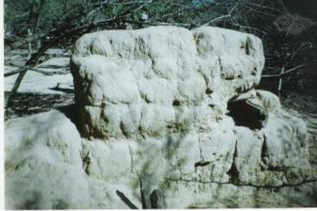
Ruinas de cuartel boliviano – Paraje Las Conchas – Bolivia

Las comunidades a las que pertenecían los caciques decidieron vengar sus muertes. Fueron hasta el cuartel, preparados para enfrentarse con los soldados: