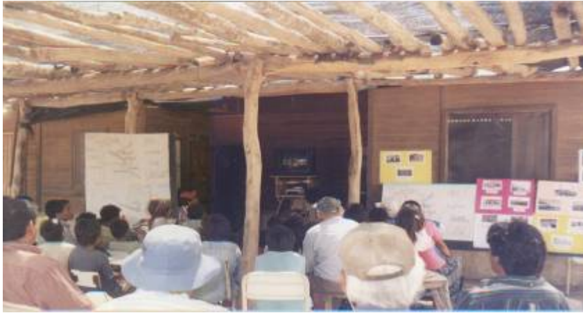
Taller sobre La Guerra del Chaco – La Estrella - Año 2003

Quienes integramos la comisión estamos convencidos de la legitimidad de los reclamos por los derechos a las tierras, al territorio y a la identidad de los pueblos originarios, es por eso que nos interesamos en este tema. Pensamos que es muy importante reflexionar sobre la historia, porque la forma en que se presenta el territorio hoy se relaciona con las cosas que pasaron antes. A la vez, creemos que la historia se va construyendo día a día, por eso todo lo que hagamos puede contribuir a construir un futuro mejor.