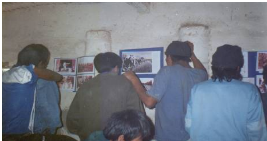
Taller sobre la Historia del Lote Fiscal 55 – La Puntana – Año 2002

De todos estos trabajos surgió la necesidad de conocer más sobre la Guerra del Chaco. Por eso, en el año 2003, se realizó un taller centrado en este tema. En este espacio, las personas que participaron contaron sus experiencias personales y familiares, y pensamos juntos que era necesario que existiera un documento escrito para que leyeran las próximas generaciones.